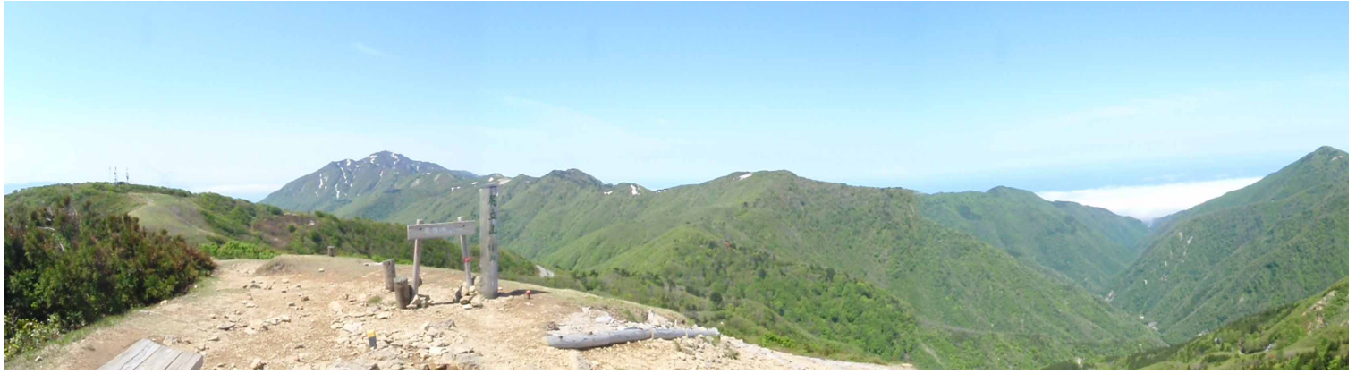
▲ 尻立山からのパノラマ