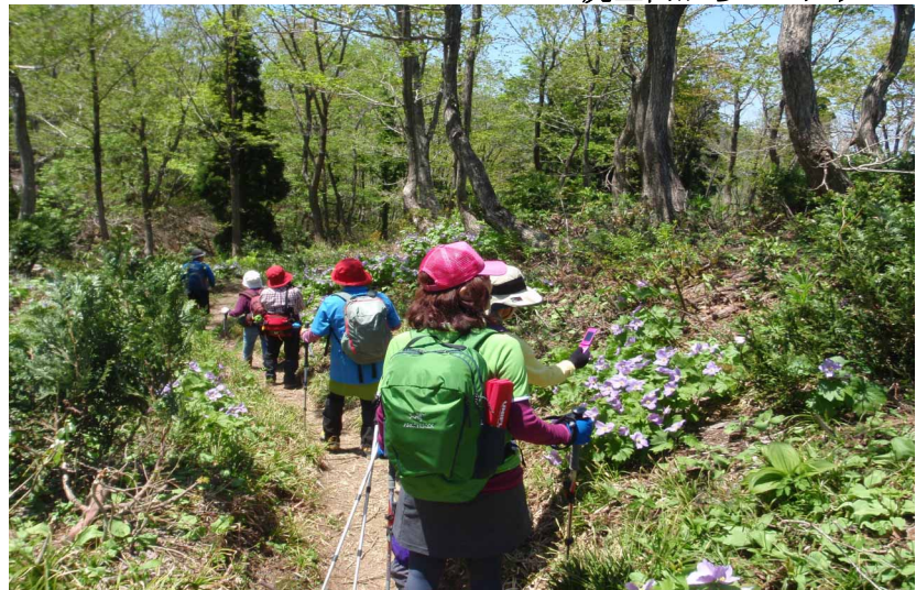
▲ シラネアオイの群生地を歩く

07:00・起床・朝食 07:50・長谷寺 10:20・小木港 13:00・直江津港 23:30・今治着